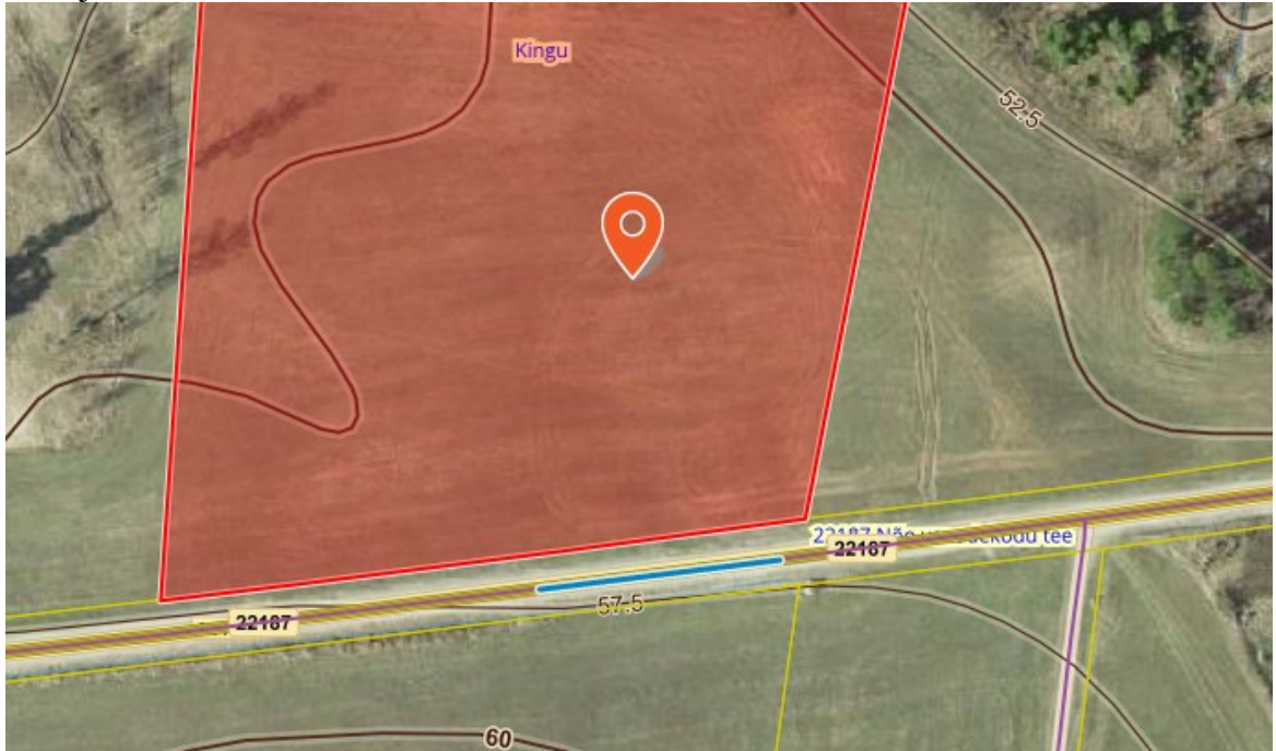
Joonis 1. Ristumiskoha asukoha sobilik vahemik tähistatud sinise joonega.